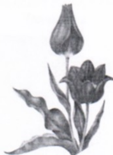
д) Тюльпан Шренка