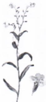
г) Незабудка болотная