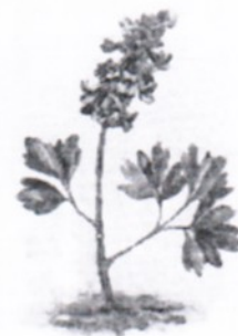
е) Хохлатка плотная +