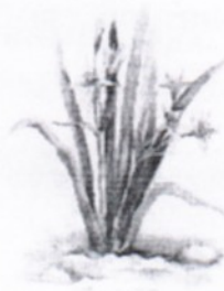
б) Гусиный лук, или Гейджия