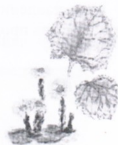
в) Мать-и-мачеха обыкновенная