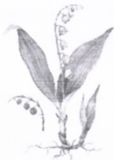
а) Ландыш майский

18 Весеннецветущие растения, или первоцветы – это многолетние травянистые растения с непродолжительным периодом цветения. Выберите первоцвет, у которого в распространении семян участвуют муравьи. Данный вид занесён в Красную книгу города Москвы.